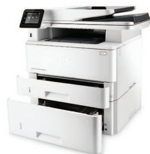
MFP (producto multifunción) HP LaserJet Pro M426fdw con bandeja de entrada de 550 hojas opcional