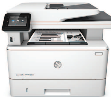
MFP (producto multifunción) HP LaserJet Pro M426fdn

Impresión, escaneo, copia y rendimiento de fax rápidos, además de seguridad sólida y amplia para su forma de trabajar. Este MFP (producto multifunción) termina las tareas clave más rápidamente y lo protege contra las amenazas. 1 Los cartuchos de tóner original HP con JetIntelligence le ofrecen más páginas. 2