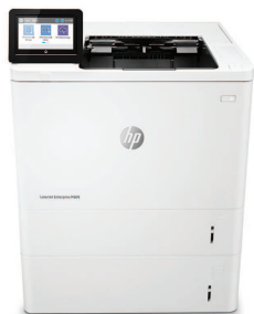
HP LaserJet Enterprise M609x