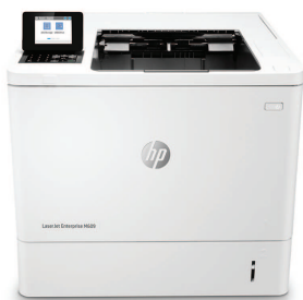
HP LaserJet Enterprise M609dn

Esta impresora HP LaserJet con JetIntelligence combina un rendimiento excepcional y la eficiencia energética con documentos de calidad profesional justo en el momento en que los necesita, protegiendo la red con la mayor seguridad del sector. 1