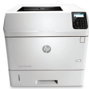
HP LaserJet Enterprise M606dn

Impulse los resultados comerciales y produzca una calidad de impresión superior. Ocúpese de trabajos grandes y equipe a grupos de trabajo para alcanzar el éxito, dondequiera que el negocio lo lleve. 2 Administre y amplíe con facilidad esta impresora súper rápida y versátil, y ayude a reducir el impacto ambiental.