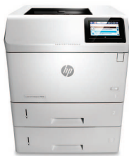
HP LaserJet Enterprise M606x