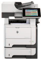
HP LaserJet Enterprise 500 M525f MFP