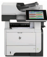
HP LaserJet Enterprise flow M525c MFP