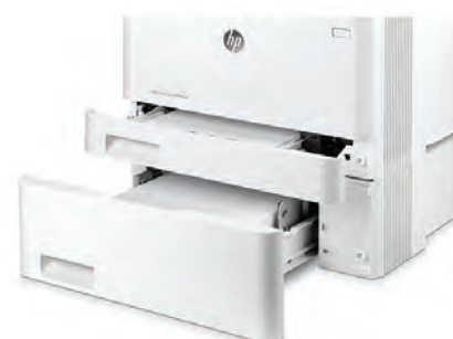
HP LaserJet Pro M452dn con bandeja de 550 hojas opcional