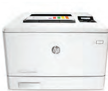
HP LaserJet Pro M452dn

Un rendimiento ideal de impresión y seguridad sólida para su forma de trabajar. Esta impresora en color compatible acaba los trabajos más rápido y ofrece amplia seguridad para la protección contra las amenazas. 1 Los cartuchos de tóner original HP con JetIntelligence producen más páginas. 2