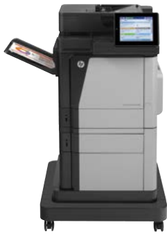
HP Color LaserJet Enterprise MFP M680f

Haga frente a trabajos de gran volumen con una MFP a color de alto rendimiento. Imprima y copie en tamaño carta y A4, y cuente con escaneo y fax. Los recursos de escaneo optimizados y la pantalla táctil a color de 8 pulgadas agilizan los flujos de trabajo. Las opciones de impresión móvil lo ayudan a mantenerse productivo fuera de la oficina. 2